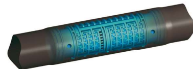
Tandem - GDF 3 x 2 otvory Tandem - IR 2 x 2 otvory