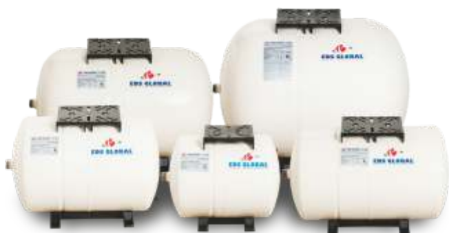
Horizontální nádoby Horizontal Tanks