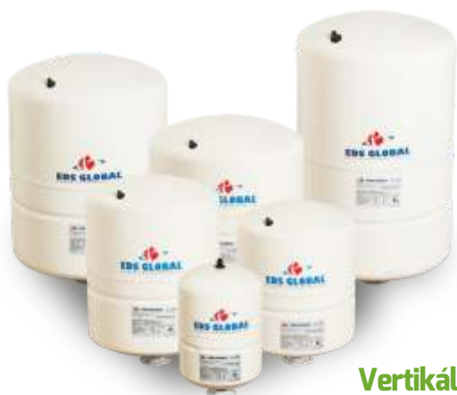
Vertikální nádoby bez podstavce Vertical Tanks Without Leg