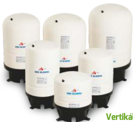
Vertikální nádoby s podstavcem Vertical Tanks With Leg